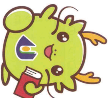
フコインキャラクター「オロリン」

地域の皆さまに、本学の公開講座をはじめ各種イベントにご参加いただき、大学をより身近な存在として感じてもらうとともに、大学の諸活動を応援していただくため、平成23年度より浜田キャンパスサポーター制度を設けています。大学イベントのご案内など様々な《特典》を用意して、たくさんの皆さまからの申込をお待ちしております。