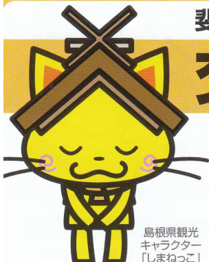
島根県観光キャラクター「しまねっこ」