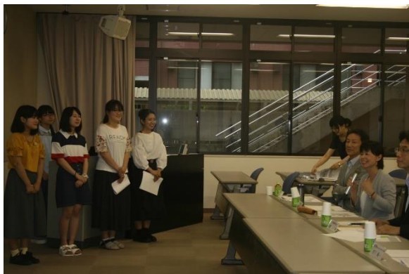
結果発表・参加者記念撮影