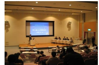
【過去の公開審査会の様子】