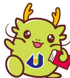
公立大学法人 島根県立大学