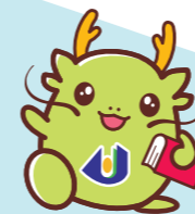
マスコットキャラクター「オロリン」

発行 島根県立大学 魅力化推進本部 入試改革・高大連携推進室 (担当：浜田キャンパス連携交流課) 2022(R4)年3月発行