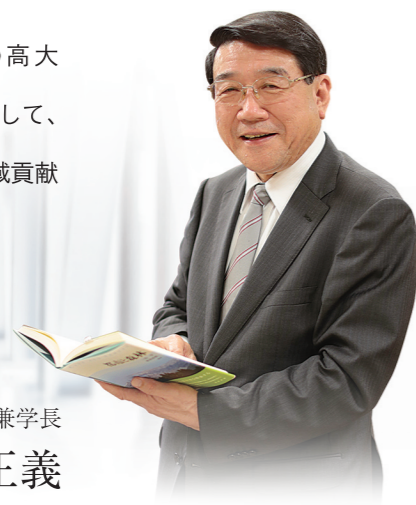
島根県立大学 理事長兼学長

私たち島根県立大学は、この高大連携の充実を原動力のひとつにして、「島根創生」に貢献するとともに「地域貢献日本一」を目指しています。