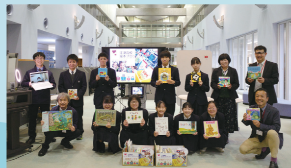
撮影時のみマスクを外しています。

「バーチャル国際交流」で「ラオス語絵本プロジェクト」に取り組む大学生の活動を聞いた江津高校の生徒有志 13 人が、自分たちでもできることを、と高校での活動を開始。高校の学園祭等で絵本の寄附を募り、生徒自身の手で翻訳、絵本にラオス語訳を貼り、教育環境が十分ではないラオスの子どもたちへ届けています。