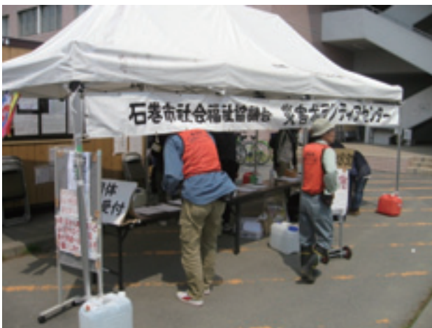
2011年5月19日 石巻市社会福祉協議会の災害ボランティアセンターは、社協の建物も津波で流されたため、プレハブとテントで運営されていた。