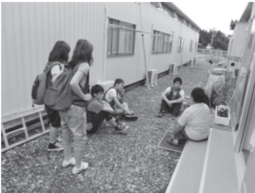
写真：仮設住宅入居者の方と対話する学生たち

GINGA-NET は冬・春とその時々状況に合わせて継続して展開していきます。皆さんの支えなくしては成り立ちません。今後とも多くのご支援よろしくお願ひします。