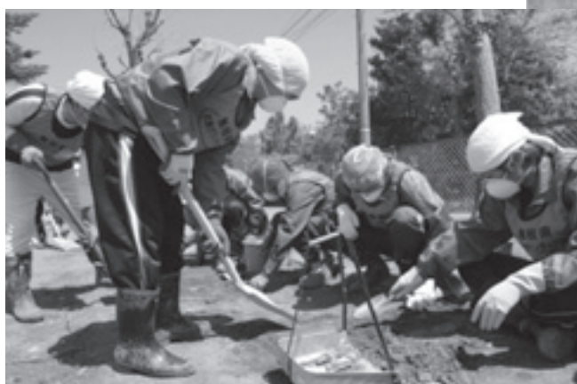
右上写真：第6クールによる 側溝の泥だし作業