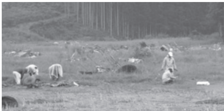
写真：第1クールによる草刈作業

波に大事なものを全てさらわれてしまって、その苦しさを理解してあげることにはできないが、私は彼らのことを一生支援し続けようと感じさせられた。このボランティアに来たことで、より強く日本は繋がりが合わなければならないことを再確認した。本当に来て良かった。ここに来る前、実家に久しぶりに帰った時、家族に不平不満を言うてしまうことがあった。しかし、家族さえも幸せにすることができない自分に、被災地の人々を支えることはできないとそう感じた。これからの生活、周囲の私の身近にいつもいる人々のことをもっと愛し、それらの人が私といると幸せだなあとそう感じてもらえるような人になっていく必要が以前より強く求められているなあと感じた。