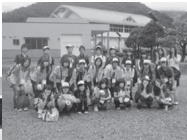
写真：いわて GINGA-NET 第6期 参加者と記念撮影