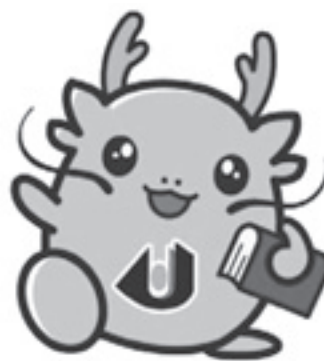
マスコットキャラクター 「オロリン」