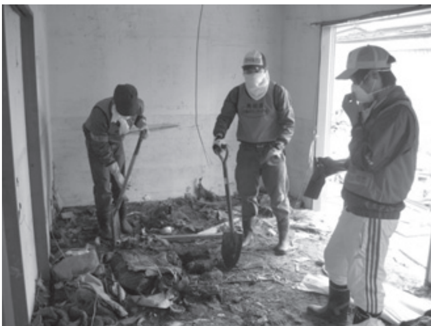
写真：第2クール アパートの 清掃と泥だし

・近くに水産加工場があったため家の中まで魚が流れこんでおり、それらは腐敗し、悪臭を放っていた。重労働でもあった。アパートの部屋数が多く、時間内に終わるか心配だったが、無事終えることができ達成感があった。今回の活動を通して、自分がやったことはほんとうに小さいことかもしれないけれど、現地の方々にとっては大きな力になれたのではないかなと思う。素人の自分が行って、最初は不安で仕方なかったが、ボランティア隊のみなさんや現地の方々に支えられて、無事終えることができた。また、学ぶことや元気、勇気づけられることも多かった。様々な人に感謝したい。これから自分には何ができるのかよく考えて、この経験を忘れずに生活していきたい。