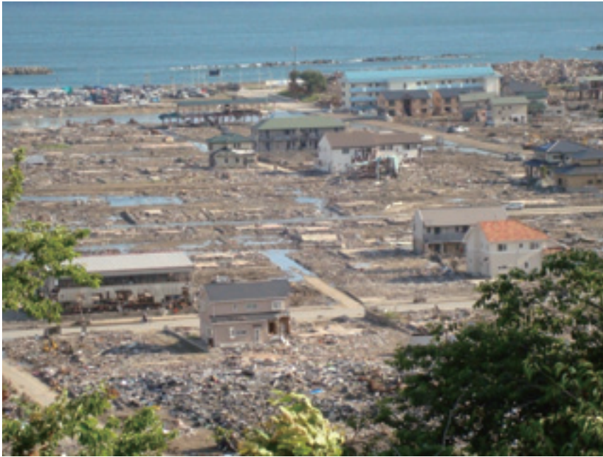
2011年6月14日 日和山公園から見た、壊滅的な被害を受けた石巻市沿岸部の様子。