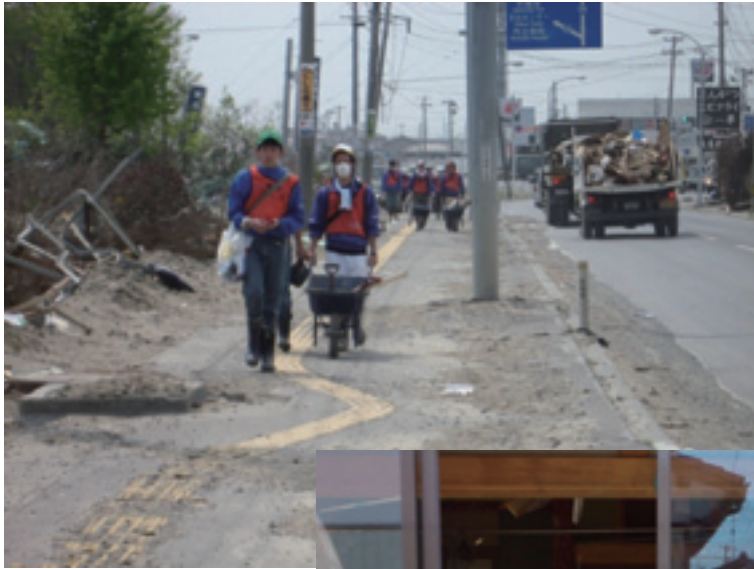
2011年5月17～19日 石巻市渡波地区で家屋・ アパートの清掃を行った。 街の至るところに流された 家財道具と思い出の品々が積 まれ、そして運び出されてい った。