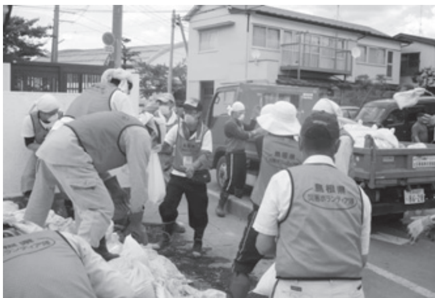
写真：第5クールの土砂運搬作業