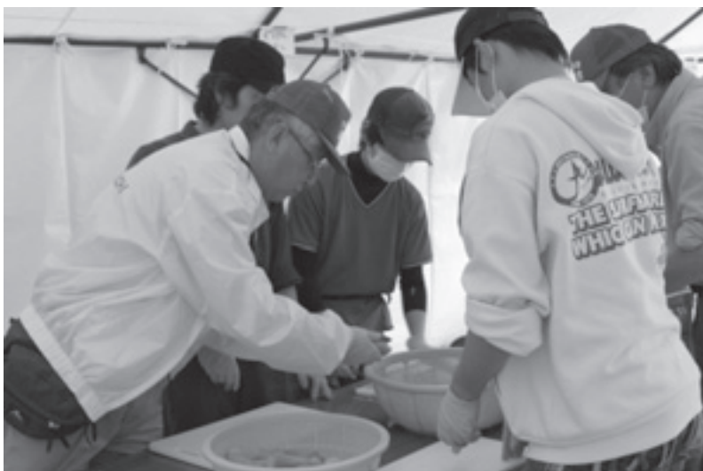
写真：「浜田を明るく照らし隊」メンバーによる炊き出しの食材下拵えの様子

・炊き出しに関しても、避難されているすべての方に行き渡っているわけではなく、安定した供給ができていないとは言い切れない。ボランティアの数において、安定した供給を行ない、少しでも早い復興に向けて、様々な形で支援させていただくことの重要性を感じた。