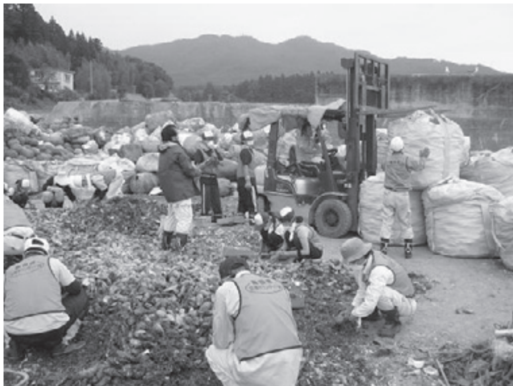
写真：第2クールによる牡蠣の貝殻と瓦礫の仕分け作業

・今日の作業は慣れてきたこともありましたが、同じボランティアとして参加された方と話をしながらだったため、非常に短く時間が感じました。今回のボランティアを通して漁港のみなさんの温かさや、今回参加されたボランティアの方々と気持ちを共有できたことは非常に良かったです。