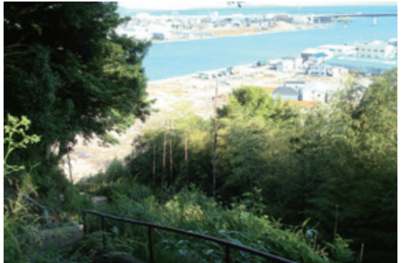
2011年6月14日 日和山公園の「命の道」。 津波発生時、多くの人々が日和山につながるこの坂道を登って、難を逃れたと聞いた。