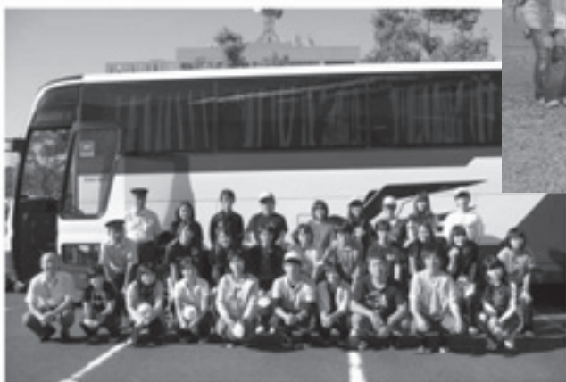
東日本大震災 島根県立雲出ボランティア隊 プランニングチーム 平成23年8月1日～8月6日

また最後に、ボランティア活動が成り立つのは送り出してくれる学校や受け入れてくれる現地、そして同じ目的を持った人々がいたからだということに感謝したいと思います。