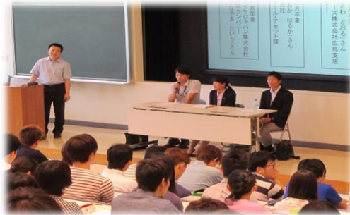
キャリア形成Ⅰでの様子

また、東日本支部総会のページ（7ページ）でもお伝えを致しましたが、就職活動時期の後ろ倒しを受けまして、今年度は就活合宿を行う予定をしております。次年度もどのようになるかはまだ不透明ですが、現役生にとって同窓生のお話を聞く機会は貴重なものと考えております。今後ともそれぞれの支部総会などの活動に参加させて頂き、そのような機会を設けて頂ければ幸いです。皆さまのお力添えを賜りますようよろしくお願い致します。