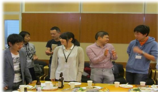
第5回定例総会懇親会の様子