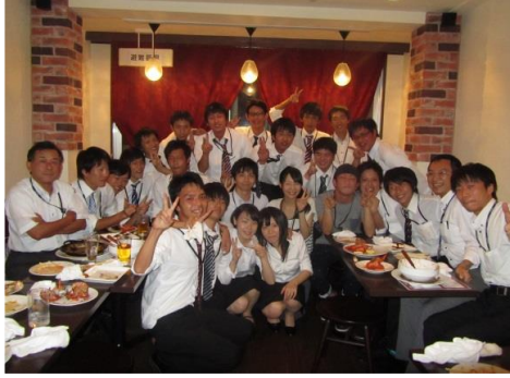
←夏期山陽合宿激励会

また、8月～9月に『夏期企業訪問合宿』を開催しており、今年度は東京、関西・中部、山陽、島根県内の4コースを開催し、各コースとも20名前後の参加がありました。学生は、初めて何う各企業の事業紹介や求める人物像と“今の自分”がかけ離れていることに気づかされ愕然とします。このような時に、自身の経験を交えた話で学生を支えてくださるのがOB・OGです。同窓生の皆さんも、「就活激励会」や「夏期合宿激励会」にご参加頂き、現役生の励みになって頂きたいと思えます。