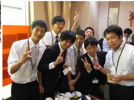
夏期東京合宿激励会→