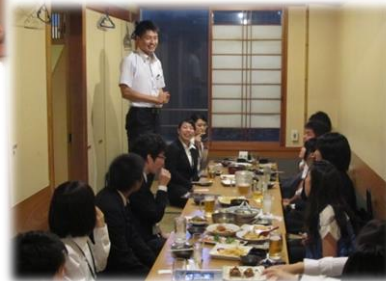
関西・中部夏季合宿