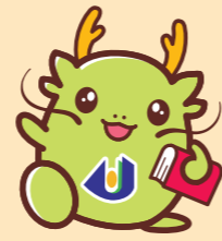
島根県立大学マスコットキャラクター オロリン