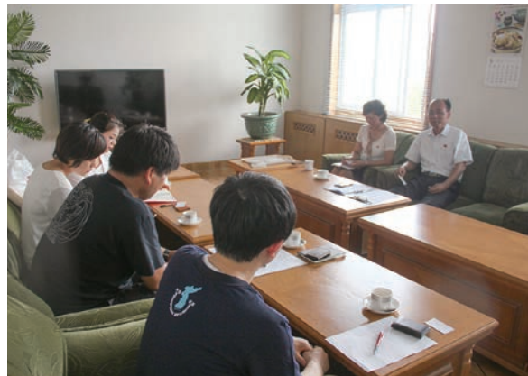
朝鮮の環境問題について筆者の質問に答える朝鮮社会科学院の研究者（2017年8月16日）

昨年この欄に、今年度（つまり2017年度）は筆者が中心に関わる二つのプロジェクト（北東アジアの環境問題と、モンゴルにおける国際シンポの開催及び朝鮮人労働者の実態調査）について成果を収めることが課題であると記したが、一年を過ぎた今、何とか及第点を与えることができそうだ。環境問題のほうは、夏に朝鮮へ赴いて聞き取り調査を行い、その成果を国内の研究会や韓国で実施した小さなシンポジウムで発表した。