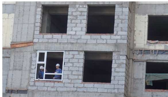
高層アパートの建設現場で働く朝鮮人派遣労働者（2017年9月7日）