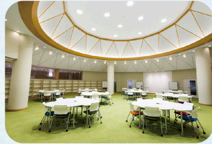
ラーニングコモンズ