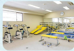
アスレチックルーム