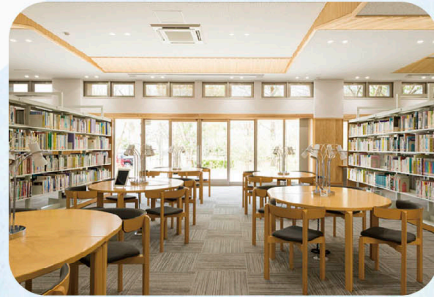
図書館(蔵書数67,000冊他雑誌・電子ジャーナル多数あり)