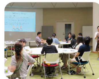
ラーニングcommonsでの授業