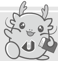
マスコットキャラクター「オロリン」