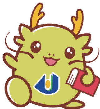
島根県立大学 マスコットキャラクター オロリン