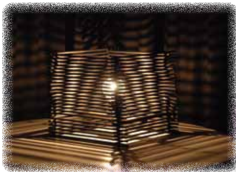
割り箸を墨で塗り、積み重ねて作った作品です。形は真四角ではなく、ひし形になっています。角度によって見え方が異なるのがおもしろく、割り箸の黒と光の色が暖かい雰囲気を出しています。(写真右・左) 生活文化デザイン系2年生 長谷川早紀