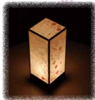
シンプルな形ですが、桜の花びらを貼ることで可愛い感じになっています。場所によって桜の数が異なるのがポイント。(写真左) 生活文化デザイン系2年生 妹尾奈津希