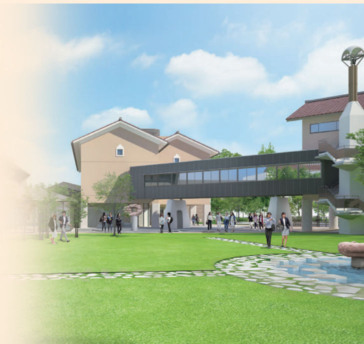
出雲キャンパスイメージ (健康栄養学科棟新築)

※2 栄養教諭…児童生徒に対する食に関する指導や、学校給食の管理などを行う教諭のこと。