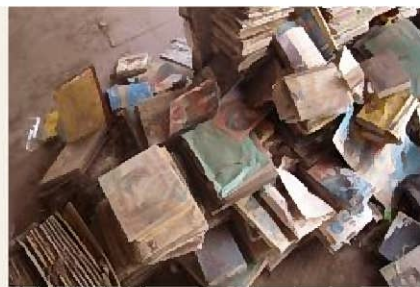
読めなくなってしまった本