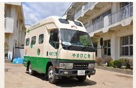
移動図書館 やまびこ号

現在、移動図書館車や仮設図書館を運営していますが、市民、そして子どもたちが本に親しめる場が少なくなっているのが現状です。図書館は子ども、大人が集えるコミュニティースペースとしての役割だけでなく「本を読む」ことで人の心を豊かにしてくれる場所でもあります。