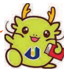
公立大学法人島根県立大学 マスコットキャラクター