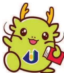
マスコットキャラクター：オロリン

命名理由 ：「オロリン」は、私が大学で初めて見て以来、ずっと“可愛いな”と感じているキャラクターです。そんなオロリンが色んな方に愛されるように、そして、その名前の付いた広報誌が地域の方に愛され、手にとって読んで頂けるようにとの思いからこのタイトルにしました。