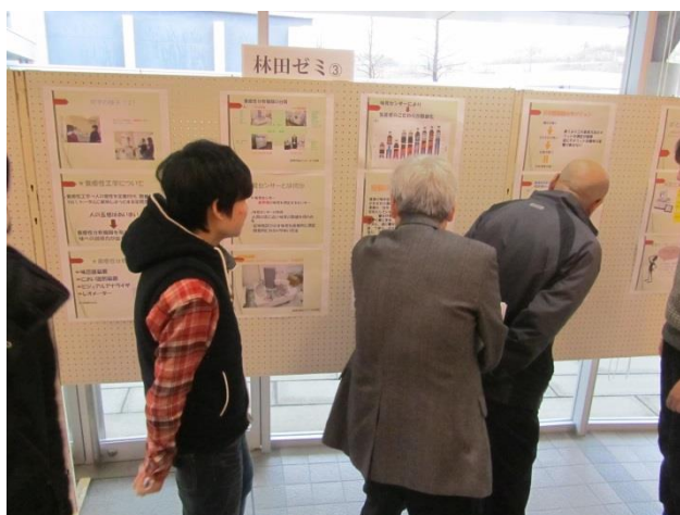
昨年度の合同成果発表会の様子