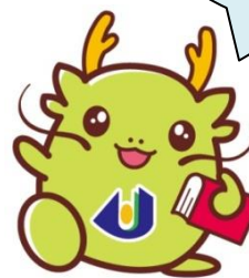
マスコットキャラクター「オロリン」

ご参加いただける場合は、メールもしくは FAX にて下記 4 点を必ず記載の上、 2月10日(水)まで に