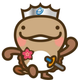
邑南町マスコット キャラクター オオナン・ショウ