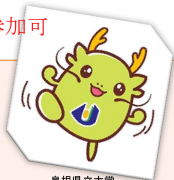
島根県立大学 マスコットキャラクター オロリン