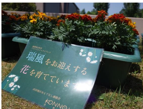
マリーゴールドは見事に咲きました。

※この活動は、瑞風の歓迎だけでなく、7月からJR 西日本が行なっている「山陰デスティネーションキャンペーンプレキャンペーン」の活動も兼ねています。