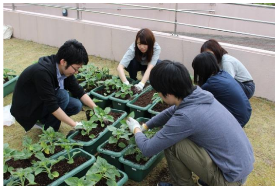
ミニひまわりも想いを込めて育てています。